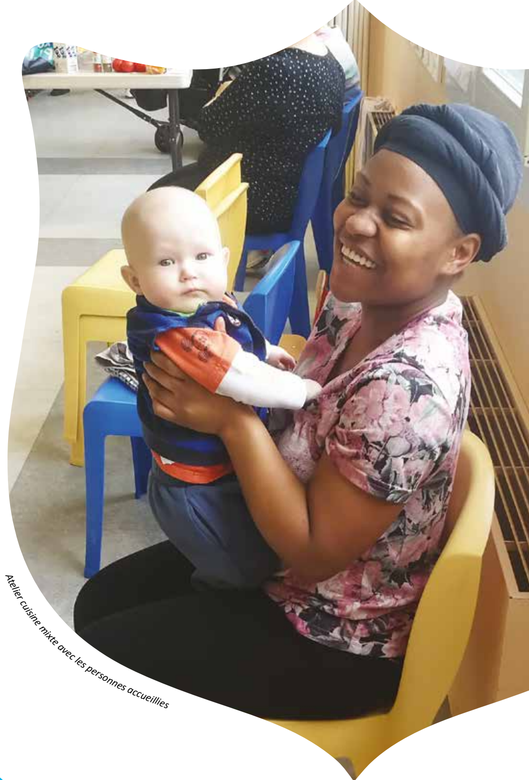
Atelier cuisine mixte avec les personnes accueillies