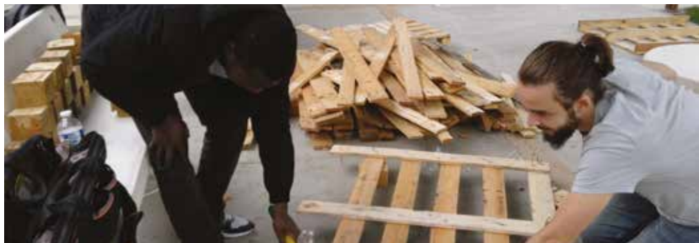
Atelier palettes au Toit Solid'Air