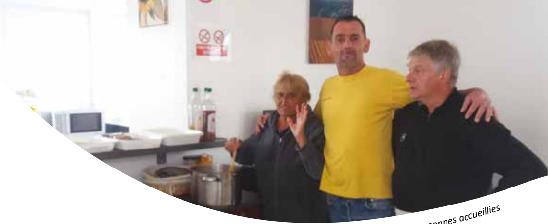
La cuisine du Toit Solid'Air gérée par les personnes accueillies