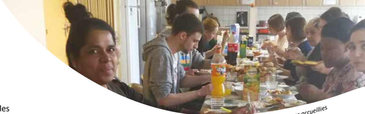
Atelier cuisine mixte avec les personnes accueillies

LA DURÉE MOYENNE DES SÉJOURS EST DE : 450 JOURS.