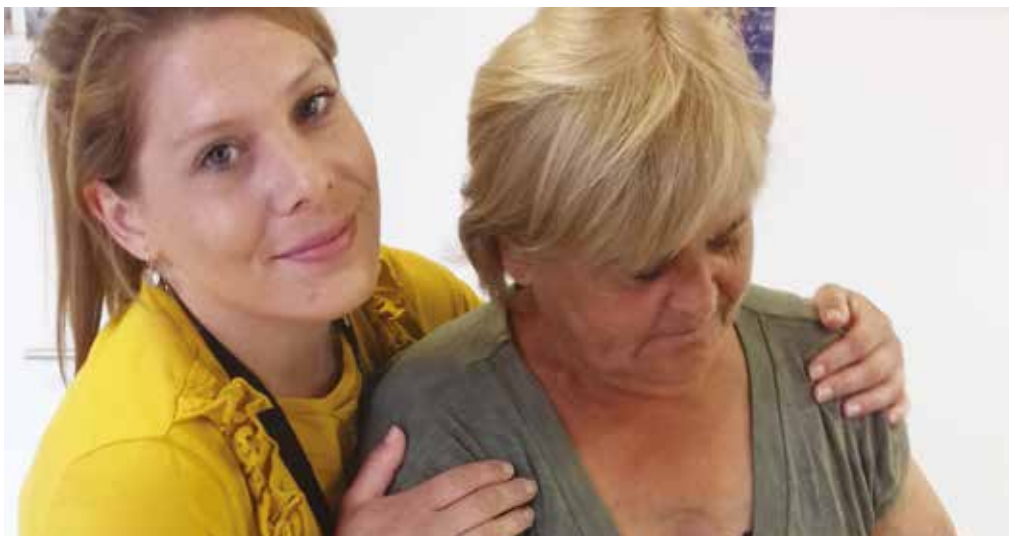
Atelier couture au Toit Solid'Air

Ouverture des droits et orientation vers les partenaires.