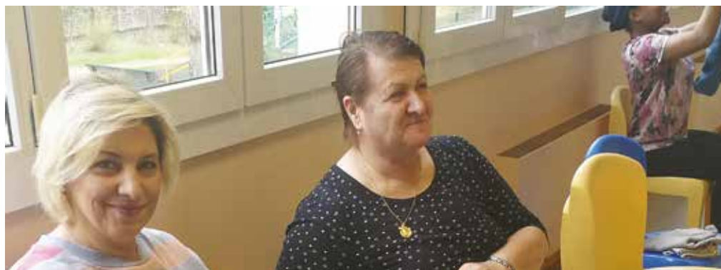
Atelier cuisine mixte avec les personnes accueillies