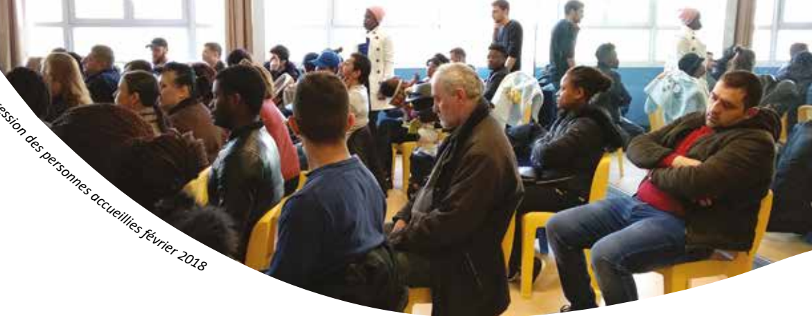
Réunion d'expression des personnes accueillies février 2018