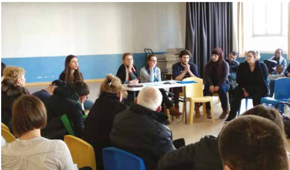
Réunion d'expression des personnes accueillies février 2018