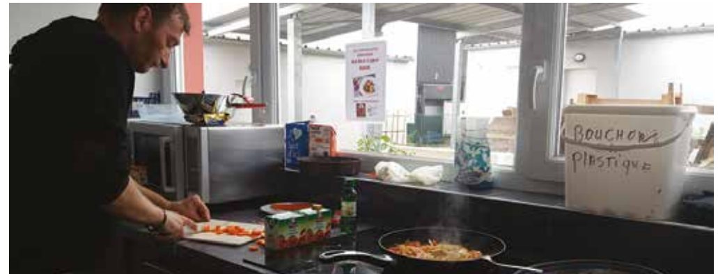
Cuisine au Toit Solid'Air

LA DURÉE MOYENNE DES SÉJOURS EN 2019 EST DE : 145 JOURS.