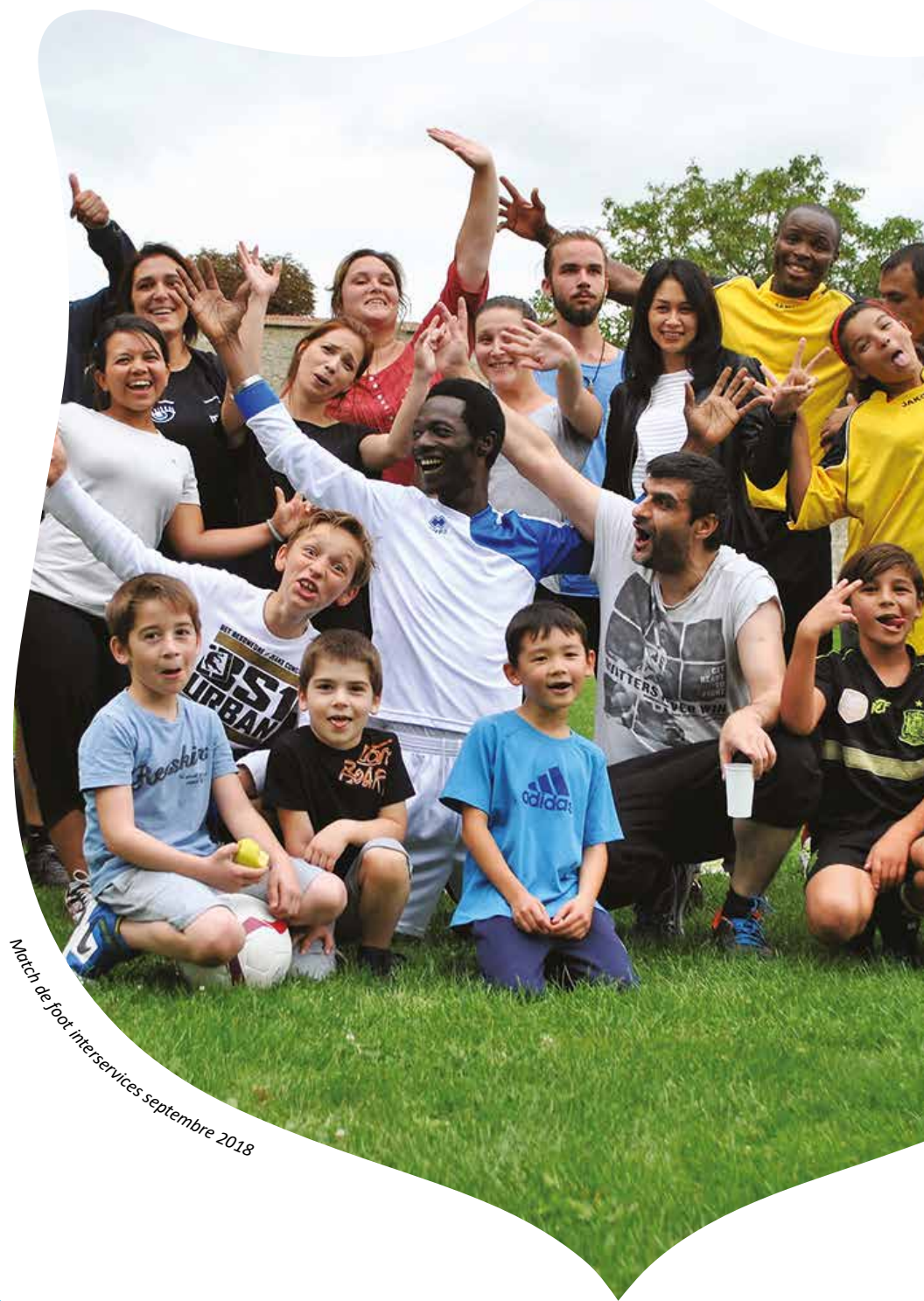
Match de foot inter-services septembre 2018

Les fiches actions définissent assez précisément les éléments de diagnostic et de contexte et devraient permettre d'apporter des correctifs dans une perspective d'avenir. Il ne faut pas oublier que ces sites HU diffus et Toit Solid'Air sont les premiers accueils pour les personnes très éloignées du logement d'abord et portant des problématiques multiples.