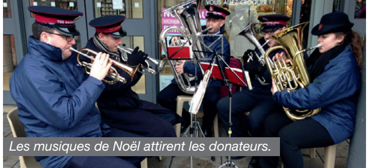
Les musiques de Noël attirent les donateurs.

Le sud de l'Angleterre et le nord de la France ne sont séparés que par un bras de mer d'une trentaine de kilomètres - d'où le nom La Manche ! Mis à part les frontières organisationnelles