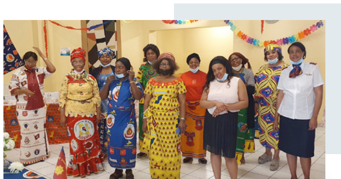
Rallye Territorial des Ministères Féminins et Famille

C'était une première pour notre territoire, de vivre un congrès virtuel, par région et par poste pour la Belgique. Ce congrès s'inscrivait dans la reconnaissance de la fidélité de Dieu pour les