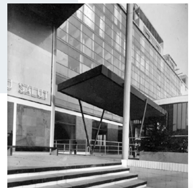
« Cité de refuge » à Paris

◀ Avec ce code QR, regardez le reportage des actualités cinématographiques de 1933 sur l'inauguration de la Cité de Refuge.