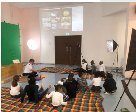
Programme pour les enfants retransmis en direct

Un programme intitulé « Heure de Joie » a été proposé aux enfants âgés de 6 à 11 ans, avec des chants et un enseignement « Godly Play » centré sur la vie de Catherine Booth, la « mère » de l'Armée du Salut.