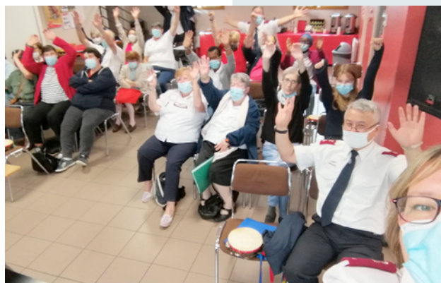
Rassemblement en Normandie